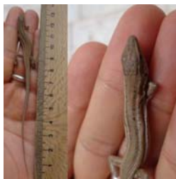
شکل ۱۵- کویر مرنجاب، خانواده لاسرتیده، گونه

جنس ماده ۱۰ الی ۱۴ عدد، تعداد منافذ پیش‌رانی در جنس نر ۲۲ الی ۳۰ عدد و برای جنس ماده ۲۱ الی ۲۹ شمارش شدند (شکل ۱۵). بزرگترین نمونه جمع‌آوری شده از گونه O. elegans در شهرستان ایلام دارای طول پوزه تا مخرج حدود ۵۱/۰۲ میلی‌متر و در شهرستان هرسین برای نرها ۴۴/۸۸ تا ۵۲/۲۸ میلی‌متر و برای ماده‌ها ۴۴/۴۷ تا ۵۱/۴۵ میلی‌متر گزارش شده است. طول پوزه تا مخرج در نمونه‌های مطالعه شده در استان کهگیلویه و بویراحمد بین ۳۲/۴ تا ۵۳ میلی‌متر، در نمونه‌های کردستان ۵۴ میلی‌متر و طول دم ۱۲۰ میلی‌متر ثبت شده است. مقایسه مطالعه بیومتری نشان می‌دهد که بین صفت پوزه تا مخرج سوسمار مارچشم در منطقه مورد مطالعه با نمونه‌های کردستان و کرمانشاه هم در اندازه و هم در رنگ‌آمیزی متفاوت است. این‌گونه در بیشتر طول روز و در اکثر ماه‌های سال فعال است و اغلب در مکان‌های آفتاب‌گیر فعالیت می‌کنند. تنوع رنگ در این‌گونه وسیع است. این‌گونه از اطراف زمین‌های زراعتی، تپه‌های پوشیده با گیاه گون جمع‌آوری شده است (۳ و ۴).