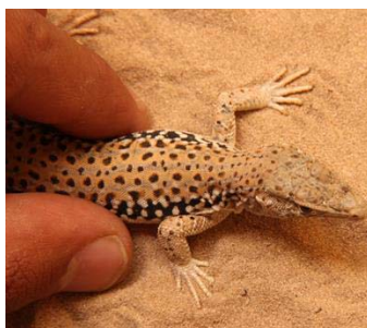
شکل ۱۳- کویر مرنجاب، خانواده لاسرتیده، گونه

تعداد منافذ رانی ۴۳ الی ۳۹ عدد با میانگین ۴۱ شمارش شدند. این گونه در دشت‌های باز و یا دامنه‌ها با زمین‌های پوشیده از سنگریزه و ریگزارها آمیخته با ماسه‌سنگ، خاک-های رسی، سنگ‌های رسی خردشده، خرده سنگ‌های رسوبی، همراه با پوشش گیاهی اندک یافت شد. این گونه نیز روز فعال است و اغلب در حفره‌های پای بوته‌ها مخفی می‌شوند و هنگام فعالیت نیز در نزدیکی بوته‌ها دیده می‌شوند. محل نمونه تیپیک از ایران، حوالی اصفهان در استان اصفهان می‌باشد و در ارتفاعاتی بین ۶۰۰ تا ۳۰۵۰ متر یافت شده است. گونه‌ی Eremias persica در میان گونه‌های جنس Eremias از جثه بزرگتری نسبت به سایر گونه‌ها برخوردار است و در خاک‌های متفاوتی دیده می‌شود و معمولاً در محیط‌های که تراکم گیاهان بالا باشد دیده نمی‌شود (۱۵).