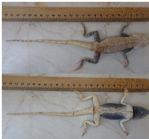
شکل ۳- کویر مرنجاب، خانواده آگامیده، گونه Trapelus agilis

۱. Trapelus agilis (Oliver 1804): بزرگترین نمونه اندازه‌گیری شده از T. agilis در این پژوهش دارای طول پوزه تا مخرج و طول دم به ترتیب ۹۶ و ۱۶۱ میلی‌متر در جنس نر و ۹۴ و ۱۶۰ میلی‌متر در جنس ماده است. میانگین طول دم در جنس نر ۱۵۶/۲ و در جنس ماده ۱۳۳/۵ میلی‌متر به دست آمد. این نشان می‌دهد طول دم در نرها بیشتر از ماده‌ها است (شکل ۳). رستگار پویانی و همکاران (۱۳۸۶) طول پوزه تا مخرج T. agilis را ۱۱۵ میلی‌متر و طول دم را ۱۷۷ میلی‌متر گزارش دادند (۹). در حالی‌که یاری (۱۳۸۹) و بهمنی (۱۳۹۰) به ترتیب در کرمانشاه و کردستان اندازه طول پوزه تا مخرج را ۹۴/۵ تا ۱۵۴ میلی‌متر و ۱۷۵،۶ تا ۱۴۴ میلی‌متر گزارش دادند (۳ و ۱۶). از نظر پراکنش با دو گونه دیگر خانواده آگامیده در ناحیه مورد مطالعه همپوشانی دارد. این گونه در روزهای آفتابی بیشتر دیده می‌شود و مطالعات نشان می‌دهد که از حشرات، عنکبوتیان، هزارپایان و گاهی از مواد گیاهی تغذیه می‌کنند (۳).