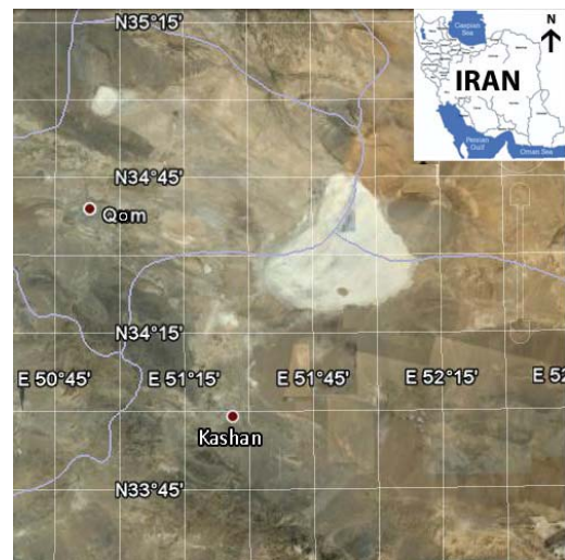
شکل ۱- موقعیت منطقه نمونه‌برداری واقع در کویر مرنجاب

منطقه مورد مطالعه: کویر مرنجاب با مختصات 50^{\circ}45' طول شرقی و 35^{\circ}15' عرض شمالی در شمال شهرستان آران و بیدگل استان اصفهان قرار دارد. این کویر از شمال به دریاچه نمک آران و بیدگل، از غرب به کویر مسیله و دریاچه‌های نمک حوض سلطان و حوض مره، از شرق به کویر بندریگ و پارک ملی کویر و از جنوب به شهرستان‌های آران و بیدگل و کاشان محدود می‌شود (شکل ۱). ارتفاع متوسط کویر مرنجاب از سطح آب‌های آزاد حدود ۸۵۰ متر می‌باشد. قسمت عمده این کویر پوشیده از تپه‌های شنی و ریگزار است. کویر مرنجاب از نظر پوشش گیاهی بسیار غنی است و گیاهان آن را عمدتاً گونه‌های شور پسند از جمله گز، تاق و قیچ تشکیل می‌دهند که علاوه بر جلوگیری از فرسایش و حفظ خاک نمادی از استقامت در گرمای کویر هستند. دمای هوا در این منطقه در تابستان به حدود 50^{\circ}C نیز می‌رسد (۱۱).