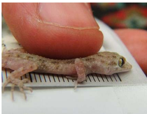
شکل ۷- کویر مرنجاب، خانواده جکونیده، گونه

پوزه تا مخرج برای جنس نر ۴۸/۹ میلی‌متر و برای جنس ماده ۵۵/۲۴ میلی‌متر گزارش شد (۹، ۱۳ و ۱۹). تعداد فلس‌های لب بالا ۹ تا ۱۲ عدد و تعداد فلس‌های عرضی شکم ۲۰ تا ۲۵ عدد شمارش گردید، همچنین تعداد ردیف‌های عرضی برآمدگی پشتی ۱۱-۱۶ ردیف شمارش شد، میانگین طول سر و عرض سر به ترتیب ۱۱/۳ و ۸/۶ میلی‌متر اندازه‌گیری شد. این‌گونه از عناصر فونی صحارا-سندی است که از خارج از فلات ایران منشأ گرفته است (۳). این‌گونه در بیشتر مناطق ایران پراکنش وسیعی دارد و ذاتاً شب فعال و حشره‌خوار است (۸). در مطالعه حاضر نیز مشاهده شد که شب فعال و حشره‌خوار است و در نزدیکی روشنایی در کمین حشرات می‌نشیند. پشت خاکستری با نقاط قهوه‌ای است که در ردیف‌های طولی منظم مرتب‌شده‌اند، اندام‌های حرکتی و دم با نوارهای عرضی تیره‌ی باریک، ناحیه‌ی شکمی سفید است (۷، ۹ و ۱۹).