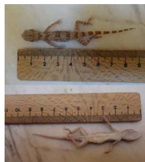
شکل ۶- کویر مرنجاب، خانواده جکونیده، گونه

۱. Bunopus crassicaudus (Nikolsky 1907) : بیشترین طول پوزه تا مخرج در نمونه‌های جمع‌آوری‌شده از کویر مرنجاب ۵۱ میلی‌متر و بیشترین طول دم ۴۶ میلی‌متر اندازه‌گیری شد که با نمونه‌های استان قم و اراک تفاوت چندانی نشان نداده است (شکل ۶). در نمونه‌ی ایرانی طول پوزه تا مخرج ۵۴ میلی‌متر و طول دم ۵۶ میلی‌متر گزارش شده است (۱۹). این‌گونه که از ضلع جنوب غربی دریاچه نمک جمع‌آوری شد. در ایران بانام فارسی جکوی دم کلفت زگیل‌دار شناخته می‌شود و محل نمونه تیپیک از قم گزارش شده است (۹). این نمونه شب‌ها فعالیت می‌کنند و زیر سنگ‌ها شکاف‌ها و غیره مخفی می‌شوند و از حشرات و عنکبوت‌ها تغذیه می‌کنند (۹). زیستگاه‌های این‌گونه در استان اصفهان با منطقه تیپیک مطابقت دارد.