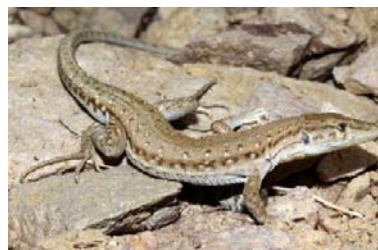
شکل ۱۴- کویر مرنجاب، خانواده لاسرتیده، گونه

عدد، تعداد منافذ پیش‌رانی در جنس نر ۲۳ الی ۳۰ عدد و برای جنس ماده ۲۳ الی ۳۱ شمارش شدند. تعداد منافذ رانی در هر طرف ۱۱ تا ۱۵ عدد شمارش شد. تعداد منافذ رانی در نرهای نمونه‌ی منطقه‌ی دامغان بیشتر از ماده‌ها بود (۶) که این خصوصیت در نمونه‌های کویر مرنجاب وجود دارد. از الگوی رنگ خاکستری یا زیتونی در بالا، پشت با سپرهای طولی از نقاط سفید کوچک که بوسیله نقاط سیاه احاطه شده است. نقاط سفید کوچک بارنگ تیره در پهلوها احاطه شده اغلب یک نوار پشتی- جانبی روشن از چشم عبور می‌کند (۹) الگوی رنگ نمونه‌های جمع‌آوری شده در این پژوهش با نمونه‌ی کتب مرجع تفاوتی ندارد. این‌گونه در بیشتر نواحی ایران غیر از شمال، و غرب و شمال غرب ایران قابل مشاهده است (۹). محل نمونه تپیک از پاکستان، سند، بین کراچی و سوکور می‌باشد (۱۹). مشاهدات میدانی نشان داد که این‌گونه روز فعال بوده و بین سنگ‌های چیده شده، زیر شاخ و برگ‌ها و سنگ‌ها و در درون حفره‌ها مخفی می‌شود و در زمین‌های پوشیده از ماسه‌بادی با درختچه‌هایی مثل گز و تاغ کمتر قابل رویت است.