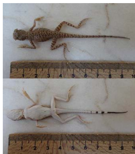
شکل ۴- کویر مرنجاب، خانواده آگامیده، گونه

مخرج ۸۰ میلی‌متر و اندازه دم ۱۲۲ میلی‌متر بود. طول دم در جنس نر ۱۲۲ الی ۵۶ میلی‌متر و در ماده‌ها ۱۰۰ الی ۶۳ میلی‌متر می‌باشد که در نمونه‌های منطقه مورد مطالعه طول دم در نرها بیشتر از ماده‌ها است (شکل ۴). میانگین تعداد فلس‌های بین چین گلویی و کلواک در جنس نر ۱۰۴/۲۵ و برای ماده ۱۰۹/۱۶ می‌باشد. بیشترین تعداد این صفت در جنس ماده ۱۲۰ و در جنس نر ۱۱۷ عدد شمارش شد. تعداد فلس‌های بین چین گلویی و کلواک در نمونه منطقه مورد مطالعه در جنس ماده بیشتر از جنس نر بوده است که اختلاف معنی‌داری را بین ماده و نرها نشان می‌دهد. بر طبق مطالعات انجام شده توسط اندرسون، نمونه‌های ایرانی دارای ۹۹ تا ۱۱۵ فلس در حول ناحیه میانی بدن بوده و اندازه پوزه تا مخرج در نمونه‌ی ایرانی ۹۱ میلی‌متر و طول دم ۱۲۸ میلی‌متر می‌باشد (۱۹). این‌گونه در بیشتر نقاط کویر مرنجاب مشاهده و جمع‌آوری شد. در هنگام روز از مورچه‌ها، قاب‌بالان و دیگر حشرات تغذیه می‌کنند ولی احتمالاً رژیم گیاهخواری نیز دارند (رستگار پویانی و همکاران، ۱۳۸۶). الگوی رنگ نمونه‌های بررسی شده در این تحقیق بارنگ آمیزی ارائه‌شده توسط سایر محققین در مورد این‌گونه یکسان است (۹).