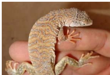
شکل ۱۱- کویر مرند، خانواده لاسرتیده، گونه

میلی‌متر و در جنس ماده ۱۴۱ میلی‌متر اندازه‌گیری شد (شکل ۱۱) که با نمونه مظفری از نظر پوزه تا مخرج تفاوتی نشان نمی‌دهد و رنگ‌آمیزی سطح پشتی بدن به رنگ زرد طلایی متمایل به قهوه‌ای روشن است که بصورت رگه‌رگه با خط‌های مشکی و قهوه‌ای سوخته پوشیده شده است (۲۴). الگوی رنگ فوق با نمونه‌ی این پژوهش تفاوتی ندارد. تعداد فلس‌های لب بالا برای جنس نر ۱۳ الی ۱۴ و برای جنس ماده ۱۵ الی ۱۳ عدد شمارش شد. میانگین طول ران در جنس نر ۱۲/۲۵ میلی‌متر و در جنس ماده ۱۴/۲۵ میلی‌متر، بیشترین طول ران در نرها ۱۴ میلی‌متر و در ماده‌ها ۱۵ میلی‌متر اندازه‌گیری شد. تعداد فلس چین گلوبی در جنس نر ۳۲ الی ۳۴ عدد و در جنس ماده ؛ بیشترین تعداد فلس چین گلوبی در جنس نر ۳۴ عدد و در جنس ماده ۳۱ عدد مشخص گردید. این‌گونه نمونه بومزاد ایران است و نمونه تیپ آن از کاشان دشت مرند است معرفی شد (۲۴). این سوسمار در ماسه بادی‌های پوشیده از گیاهان گر زندگی می‌کند.