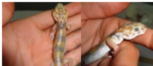
شکل ۱۶- کوبیر مرنجاب، خانواده اسفروداکتلیده، گونه

میلی‌متر ثبت شد (شکل ۱۶). مطالعه حاضر نشان می‌دهد که بین صفت پوزه تا مخرج و طول دم نمونه‌های کوبیر مرنجاب با نمونه‌های منطقه‌ی تپیک (سرچاه)، تفاوتی چندانی وجود ندارد (۱۹). تعداد فلس‌های لب بالا در جنس نر ۲۳ الی ۲۶ عدد و برای جنس ماده ۲۴ الی ۲۶ عدد؛ بیشترین تعداد فلس‌های لب پایین ۲۱ عدد در بین نر و ۲۰ عدد در بین ماده‌ها ثبت شد. میانگین تیغه‌های زیر انگشت چهارم دست در نر ۲۴ و برای جنس ماده ۲۵؛ میانگین لاملای زیر انگشت چهارم دست در نر و ماده ۲۶؛ تعداد لاملای زیر انگشت چهارم پا در نر ۲۶ الی ۲۸ عدد و برای جنس ماده ۲۵ الی ۲۹ عدد شمارش شدند. محل نمونه تپیک این‌گونه در ایران، سرچاه واقع در استان خراسان می‌باشد (۱۹). رنگ زمینه پشتی نقش دار با خاکستری روشن، زرد، نارنجی، سایه‌های مختلف قهوه‌ای است و دو نوار طولی پهن قهوه‌ای تیره در زیر بدن، اما تا دم امتداد ندارند و بریده بریده‌اند؛ پهلوها و شکم مایل به صورتی تا سفید هستند. جوان‌ها زرد تیره تا نارنجی روشن با ۴ تا ۵ نوار عرضی دودی تا سیاه‌روی بدن که روی دم نیز همین نوارها را دارند (۹).