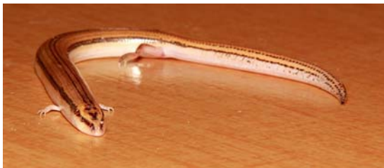
شکل ۸- کویبر مرنجاب، خانواده سینسیده، گونه