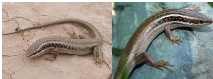
شکل ۹- کویبر مرنجاب، خانواده سینسیده، گونه Heremites septemtaeniata

۲. Heremites septemtaeniata (Reuss, 1834): طول سر ۱۴-۱۶ میلی‌متر (میانگین ۱۴/۸۳)؛ بیشترین طول پوزه تا مخرج ۸۵ میلی‌متر اندازه‌گیری شد. بیشترین عرض سر ۱۱ میلی‌متر (میانگین ۱۰/۶۶)؛ میانگین ارتفاع سر ۸/۶۶ که بیشترین اندازه ارتفاع سر ۹ میلی‌متر ثبت گردید (شکل ۹). تعداد لاملای زیر انگشت چهارم پا ۱۹-۲۲ عدد و تعداد لاملای زیر انگشت چهارم دست ۱۵-۱۶ عدد شمارش شدند. تعداد فلس در لب بالا ۹-۱۰ عدد و تعداد فلس در لب پایین ۱۴-۱۷ عدد مشخص گردید. در نمونه‌ی ایران طول پوزه تا مخرج ۱۰۵ میلی‌متر و طول ۱۲۸ میلی‌متر گزارش شده است (۱۹). ۶۵ تا ۷۲ فلس گلویی بعلاوه فلس‌های شکمی از سپر چانه‌ای تا مخرج؛ پلک زیرین با پولک‌های کم‌وبیش شفاف و تقسیم‌نشده؛ ۳۲ تا ۳۸ فلس اطراف ناحیه میانی بدن؛ سپرهای جلو پیشانی در تماس باهم نیستند؛ ۱۶ تا ۲۲ صفحه زیر انگشت چهارم (۹). گونه مذکور روز فعال است، در زیر سنگ‌ها، شکاف‌ها، صخره‌ها مخفی می‌شود و از بندپایان مختلف تغذیه می‌کنند.