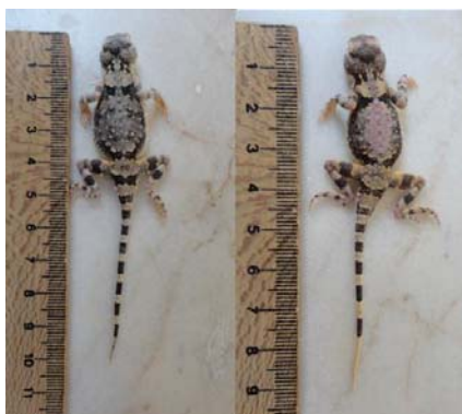
شکل ۵- کویر مرنجاب، خانواده آگامیده، گونه

بزرگترین نمونه مطالعه شده در این پژوهش دارای پوزه تا مخرج ۴۵ میلی‌متر و اندازه دم ۶۰ میلی‌متر بود. میانگین اندازه طول اندام جلویی در این نمونه ۲۲ و بیشترین اندازه طول اندام جلویی ۲۳ میلی‌متر می‌باشد و میانگین اندازه طول اندام عقبی ۳۴ میلی‌متر (محدوده بین ۳۳-۳۶ میلی‌متر) اندازه‌گیری شد (شکل ۵). فلس‌های پشتی یکنواخت نیستند و برخی ناخن مانند اند. بیشتر از ۱۶ فلس ما بین چشم‌ها بر روی سر؛ اطراف سرو گردن بدون فلس‌های ریشه‌ای شکل بلند (گاهی با فلس‌های خاردار کوتاه) است. دم ۱۱۸ تا ۱۵۷ درصد اندازه نوک پوزه تا مخرج را شامل می‌شود (۹). در نمونه‌های استان سمنان میانگین طول بدن و دم به ترتیب ۴۵ و ۵۵ میلی‌متر و بزرگترین طول بدن و دم ۵۰ و ۶۰ میلی‌متر بوده است (۶). پشت بدن به رنگ‌های خاکستری، قهوه‌ای با آثار تیره و روشن، اغلب با ناحیه بزرگ صورتی یا بنفش کمرنگ که با خاکستری تیره در قسمت میانی پشت احاطه شده است. دم با حلقه‌های سیاه که در سطح شکمی پررنگ‌تر هستند (۹). محل تپیک این‌گونه از ایران، کوه صفه در نزدیکی اصفهان است. الگوی رنگ نمونه‌های بررسی شده در این تحقیق بارنگ آمیزی فوق یکسان است و در زمین‌های باز زندگی می‌کند. همچنین قدرت تحرک و بینایی زیادی ندارد، معمولاً می‌توان به آن خیلی نزدیک شد و به‌آسانی آن را صید نمود.