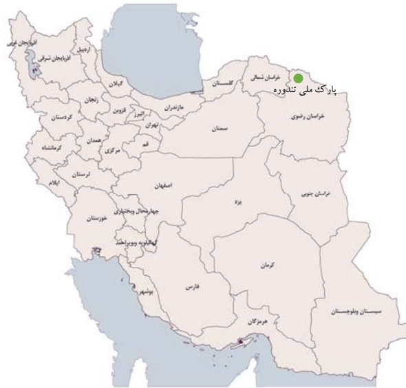
شکل ۱- موقعیت جغرافیایی پارک ملی تندوره

چوبک، بومادران، سریش، بارهنگ و انواع گیاهان یک‌ساله مرتعی و گیاهان بارزش دارویی از مهم‌ترین گونه‌های گیاهی این پارک است (۱).