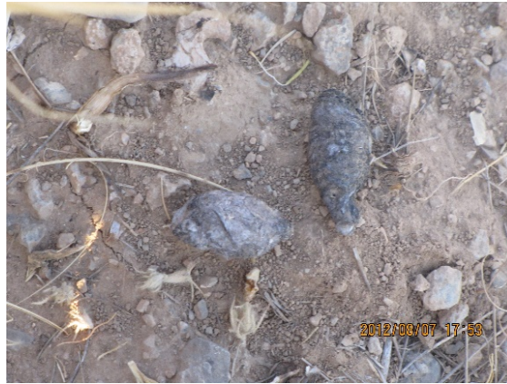
شکل ۲- نمونه سرگین پلنگ جمع‌آوری شده در پارک ملی تندوره