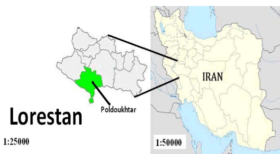
شکل ۱- نقشه شهرستان پلدختر

استریومیکروسکوپ مورد بررسی قرار گرفت. سپس شناسایی با کمک منابع تاکسونومی کتاب‌های ماهیان آب‌های داخلی نوشته‌ی اصغر عبدلی، تنوع زیستی ماهیان حوضه جنوبی دریای خزر تألیف اصغر عبدلی و مهدی نادری و کتاب ماهیان آب شیرین نوشته غلامحسین یوسفی و بهروز مستجیر صورت پذیرفت (۳، ۴ و ۷).