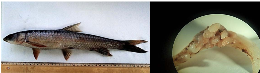
شکل ۴- گونه Barbus. grypus همراه با دندان حلقی (واحد اندازه‌گیری برحسب میلی‌متر)

نام فارسی این گونه شیریت، شبوط، سرخه (خوزستان)، شیرید (لرستان) می‌باشد. بدن این ماهی رنگی همانند آهن زنگ‌زده دارد. سطح پشتی بدن قهوه‌ای زیتونی و سطح شکمی روشن با انعکاس‌هایی نقره‌ای رنگ است. بدن کشیده، دهان زیرین، دو جفت سیبک، سر نسبتاً کوچک و در پشت باله مخرجی ساقه دم کوتاه می‌شود. باله پشتی دارای ۴ شعاع غیر منشعب، شعاع استخوانی باله پشتی دنداندار نیست و ۸ شعاع منشعب، باله مخرجی دارای ۳ شعاع غیر منشعب و ۵ شعاع منشعب می‌باشد. فلس‌ها بزرگ، مشخص، ضخیم و به‌سختی جدا می‌شوند. فلس‌های خط جانبی ۳۸-۳۴ و دندان حلقی سه ردیفی با فرمول ۲. ۳. ۵ - ۵. ۳. ۲ می‌باشد. تعداد ۸ نمونه از این گونه در ماه‌های تیر، مرداد، دی و بهمن‌ماه ۹۲ صید شد (شکل ۴).