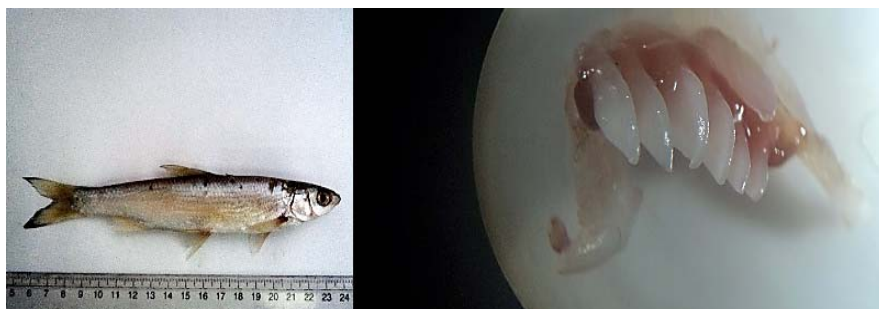
شکل ۸. گونه Chondrostoma cyri همراه با دندان حلقی (واحد اندازه‌گیری برحسب میلی‌متر)

۷,۰۹، میانگین قطر حدقه چشم: ۸,۰۷، میانگین ارتفاع سر: ۲۰,۸۵، میانگین فلس‌های خط جانبی: ۶۱,۸۵، میانگین فلس‌های بالای خط جانبی: ۹,۷۱، میانگین فلس‌های