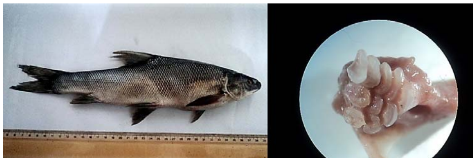
شکل ۵. گونه Capoeta damasina همراه با دندان حلقی (واحد اندازه‌گیری برحسب میلی‌متر)

طول پوزه: ۲۰,۲۲۷، میانگین طول سرپوش آبششی تا پشت حدقه چشم: ۳۲,۶۴، میانگین طول آرواره بالا: ۱۳,۴۵۷، میانگین طول آرواره پایین: ۳۳,۴۸۲، میانگین قطر چشم: ۸,۲۸۵، میانگین قطر حدقه چشم: ۹,۶۹۵، میانگین