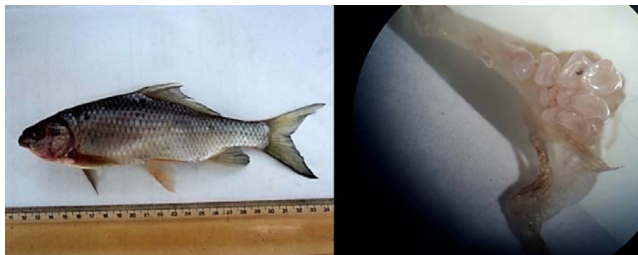
شکل ۹- گونه Cyprinion tenuiradius همراه با دندان حلقی (واحد اندازه‌گیری برحسب میلی‌متر)

میانگین طول استاندارد: ۱۱۷,۲۰، میانگین طول چنگالی: ۱۳۵,۱۷، میانگین طول کل: ۱۵۵,۰۶، میانگین طول