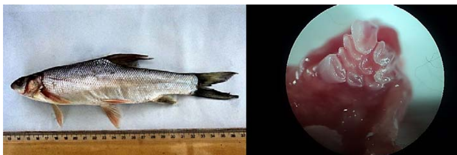
شکل ۶. گونه Capoeta trutta همراه با دندان حلقی (واحد اندازه‌گیری برحسب میلی‌متر)

نام فارسی این گونه، تویینی، گل-خورک (خوزستان)، قزل (لرستان)، شیرماهی و برزم می‌باشد. این ماهی دارای بدنی اغلب خاکستری رنگ با لکه‌های سیاه‌رنگ بزرگ در سطح بدن و یک جفت سیبلیک کوچک می‌باشد. باله پشتی دارای ۳ شعاع غیر منشعب که خارپشتی غیرمنشعب نسبتاً قوی مضرس و ۸ شعاع نرم، باله مخرجی دارای ۳ شعاع غیرمنشعب و ۵ شعاع منشعب می‌باشد. فلس‌ها کوچک و به راحتی جدا می‌شوند و تعداد آن‌ها روی خط جانبی ۷۷-۷۰ می‌باشد. دندان حلقی سه ردیفی و فرمول آن ۲.۳.۴ - ۲.۳.۴ می‌باشد. تعداد ۲۵ نمونه از این گونه در اردیبهشت، خرداد، شهریور ۹۲ و اردیبهشت ۹۳ صید شد (شکل ۶).