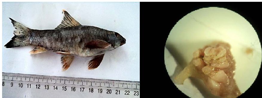
شکل ۱۰- گونه Garra rufa همراه با دندان حلقی (واحد اندازه‌گیری برحسب میلی‌متر)

میانگین طول استاندارد: ۱۰۶,۳۰۷، میانگین طول جنگالی: ۱۲۳,۶۹۲، میانگین طول کل: ۱۳۵,۰۴، میانگین طول سر: ۲۲,۰۰۳، میانگین عرض بدن: ۲۹,۶۵۲، میانگین