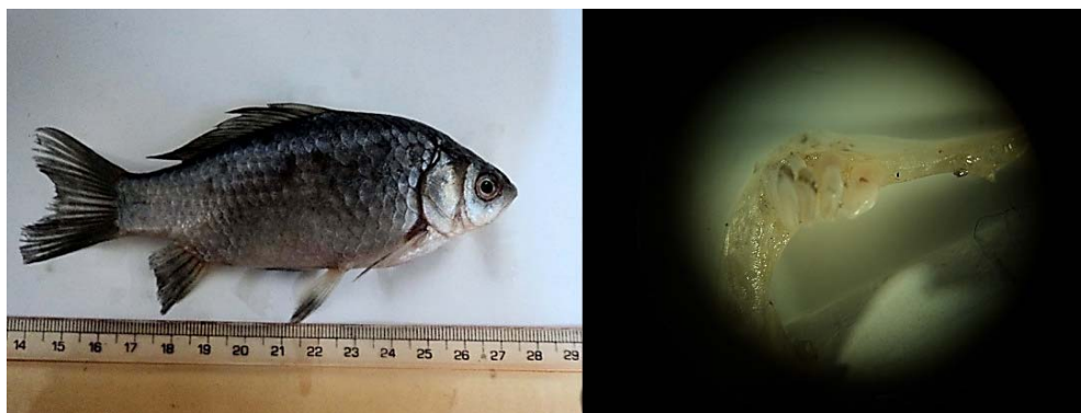
شکل ۷. گونه Carassius gibelio همراه با دندان حلقی (واحد اندازه‌گیری برحسب میلی‌متر)

میانگین طول استاندارد: ۱۳۸،۹۱، میانگین طول چنگالی: ۱۶۵،۷۷۵، میانگین طول کل: ۱۸۲،۵۳، میانگین طول سر: ۳۸،۹، میانگین عرض بدن: ۴۸،۸۷، میانگین کمترین عرض ساقه دم: ۲۷،۶۷۵، میانگین طول ساقه دم: ۶۷،۵۱، میانگین طول پوزه: ۱۰،۰۸۵، میانگین طول سرپوش آبششی تا پشت حدقه چشم: ۲۱،۸، میانگین طول آرواره بالا: ۹،۹۱۵، میانگین طول آرواره پایین: ۲۵،۵۱۵، میانگین قطر چشم: ۸،۲۲، میانگین قطر حدقه چشم: ۹،۲۸۵، میانگین ارتفاع سر: ۳۳،۸۱، میانگین فلس‌های خط جانبی: ۲۹،۵، میانگین فلس‌های بالای خط جانبی: ۵،۵، میانگین فلس‌های پایین خط جانبی: ۶، میانگین فلس دور ساقه دم: ۱۶،۵