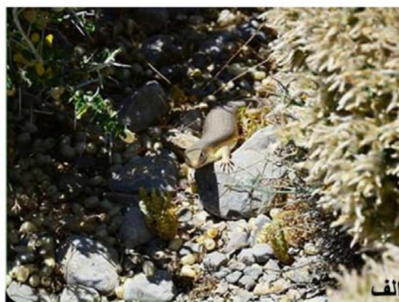
شکل ۵. گونه‌هایی خانواده Scincidae در زیستگاه طبیعی: الف) Eumeces schneiderii ب) Heremites septemtaeniatus

گونه بیشترین تنوع گونه‌ای و خانواده Gekkonidae یک‌گونه کمترین تنوع گونه‌ای را دارا بود. از خانواده‌های Anguidae، Eublepharidae، Sphaerodactylidae و Phyllodactylidae و Varanidae گونه‌ای در منطقه گزارش نشد، در این زمینه مطالعات بیشتری باید صورت گیرد.