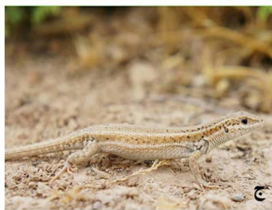
شکل ۴. گونه‌هایی خانواده Lacertidae در زیستگاه طبیعی: الف) Eremias persica ب) Mesalina watsonana ج) Ophisops elegans د) Timon princeps