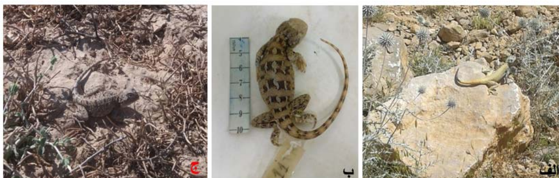
شکل ۲. گونه‌هایی خانواده Agamidae در زیستگاه طبیعی: الف) Laudakia nupta ب) Trpelus agilis و ج) Trapelus ruderatus

دامنه انتشار بیرونی آن به حاشیه فلات نیز می‌رسد (۸). این‌گونه در مناطق کوهستانی دارای سنگریزه و خانه‌های قدیمی مشاهده شد (شکل ۲ الف). Trapelus agilis فلس‌های تقریباً مساوی و یکنواخت، فلس‌های دمی به‌صورت مورب آرایش یافته‌اند و تشکیل حلقه نمی‌دهند. به‌عنوان یک کمپلکس گونه‌ای مطرح‌شده و تاکنون چندین زیرگونه از آن گزارش شده است (۳) (شکل ۲ ب). گونه‌ی