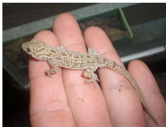
شکل ۳. گونه Cyrtopodion scabrum از خانواده Gekkonidae

از خانواده جکوها (Gekkonidae) گونه‌ی Cyrtopodion scabrum مشاهده شد. این‌گونه دارای فلس‌های زیر چانه‌ای مشخص که جفت پیشین آنها بزرگ و در تماس با یکدیگر هستند، این‌گونه جز عناصر فونی ساهارو-سیندین است که