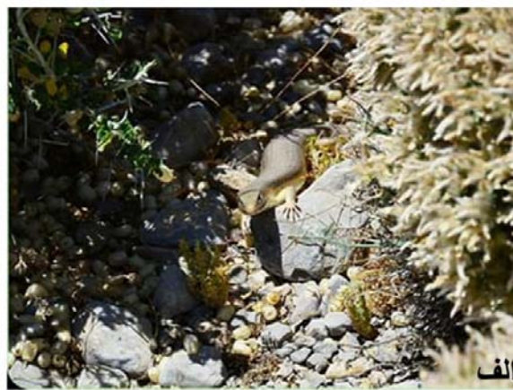
شکل ۵. گونه‌هایی خانواده Scincidae در زیستگاه طبیعی: الف) Eumeces schneiderii ب) Heremites septemtaeniatus

گونه بیشترین تنوع گونه‌ای و خانواده Gekkonidae با یک‌گونه کمترین تنوع گونه‌ای را دارا بود. از خانواده‌های Anguidae، Eublepharidae، Sphaerodactylidae و Phyllodactylidae و Varanidae گونه‌ای در منطقه گزارش نشد، در این زمینه مطالعات بیشتری باید صورت گیرد.