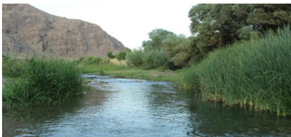
شکل ۲- نمای جانبی گونه سیاه ماهی شجریانی (بالا) و ایستگاه شماره ۴ (پایین) رودخانه دینورآب

زیستگاهی سس ماهی کورا ( B. lacerta ) در رودخانه زارم رود (۹) و بررسی شاخص مطلوبیت زیستگاه گاوماهی Ponticola cyrius در رودخانه تجن (۱۰) اشاره کرد.