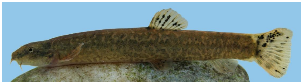
شکل ۲- تصویر جویبارماهی کرمانشاه ( Sasanidus kermanshahensis ) نمونه‌برداری شده از رودخانه دینورآب

اطمینان از صحت آن‌ها و بازیابی توانایی شنا، به رودخانه رهاسازی شدند. در شکل ۲، تصویری از نمونه زنده جویبارماهی کرمانشاه که در طول نمونه‌برداری از رودخانه دینورآب صید گردید، آورده شده است.