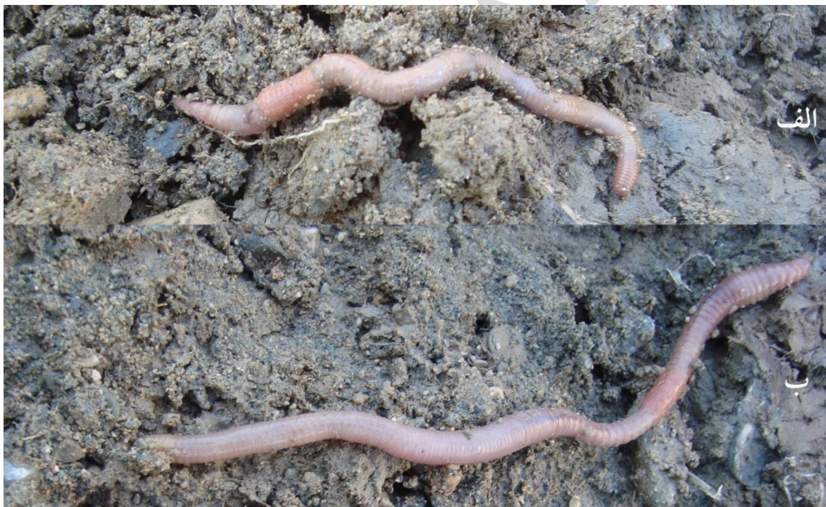
شکل ۲. تصویر گونه‌های کرم‌های خاکی؛ الف: A. rosea ؛ ب: A. trapezoides

در این مطالعه دو گونه Aporrectodea rosea (Savigny, 1826) و A. trapezoides (Dugès, 1828) یافت شد (شکل ۲). در گونه A. rosea بدن معمولاً فاقد رنگدانه بوده ولی گاهی اوقات رنگی متمایل به قرمز دارد. پیش‌دهان از نوع epilobic است. اولین منافذ پشتی بین بندهای ۵/۶ - ۴/۵ دیده می‌شوند. آرایش تارچه‌ها از نوع جفت نزدیک است. کمر بند از نوع زین اسبی بوده و از بند ۲۳ یا ۲۴ شروع شده و تا بند ۳۲ یا ۳۳ ادامه دارد. توپرکول‌ها معمولاً روی بند ۳۱ - ۲۹ قرار گرفته‌اند. مثانه در این گونه U شکل است. از صفات بارز این گونه کمر بند ویژه آن است که همراه توپرکول‌های کاملاً رشد یافته، مشخص است و به راحتی آن را از دیگر اعضای این جنس متمایز می‌سازد. در گونه A. trapezoides رنگ بدن متمایل به خاکستری است. پیش‌دهان از نوع epilobic بوده و اولین منافذ پشتی بین بندهای ۹/۱۰ - ۵/۶ دیده می‌شوند. آرایش تارچه‌ها از نوع جفت نزدیک است. کمر بند زین اسبی شکل از بند ۲۵ یا ۲۶ شروع شده و تا بند ۳۴ یا ۳۵ ادامه دارد. توپرکول‌ها به شکل ذوزنقه هستند و روی بند ۳۳ - ۳۱ قرار گرفته‌اند. مثانه در این گونه S شکل است.