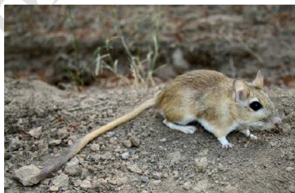
شکل ۸: جرد ایرانی Meriones persicus (اقتباس از ۲۱).

جرد ایرانی یک جونده شب‌زی و تقریباً همه‌چیزخوار است که معمولاً در مناطق خشک و کوهستانی صخره‌ای زندگی می‌کند (شکل ۸). از صفات ریختی که به شناسایی این گونه کمک می‌کند میتوان به اندازه‌های بدن شامل طول سر و بدن، اندازه گوش، طول دم (که عموماً کمی کوتاه‌تر از طول سر و بدن است)، اندازه پای عقب، رنگ خز و رنگ دندان‌های پیشین همچنین چنگال‌ها که معمولاً قهوه‌ای تیره و به طور قابل توجه بلند هستند، اشاره کرد. این گونه از شهرستان ثلاث باباجانی در این مطالعه گزارش شد.