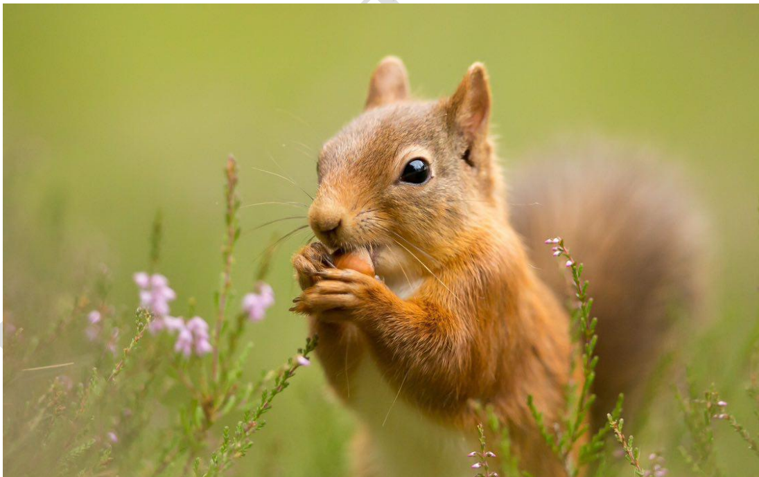
شکل ۵: سنجاب ایرانی Sciurus anomalus از منطقه اورامانات کرمانشاه.

سنجاب ایرانی تنها گونه از خانواده Sciuridae در خاورمیانه و جنوب غربی آسیا است. این گونه یک سنجاب درختی با جثه متوسط می‌باشد (شکل ۵). رنگ خز پشتی سنجاب‌های بالغ در زمستان از خاکستری مایل به سیاه کم‌رنگ تا نخودی مایل به قرمز کم‌رنگ متغیر است. رنگ شکمی اعضای این گونه از نخودی مایل به زرد کم‌رنگ روشن تا نخودی مایل به قرمز روشن متغیر است. سنجاب ایرانی در مناطق حفاظت شده نسبتاً فراوان است و به عنوان «کمترین نگرانی» در فهرست سرخ IUCN ذکر شده است. با این وجود، از دست دادن زیستگاه یکی از مهمترین دلایلی است که باعث کاهش جمعیت سنجاب ایرانی، به ویژه در لبنان، سوریه و ایران شده است. در طی این مطالعه پنج نقطه حضور برای این گونه ثبت شد (جدول ۲).