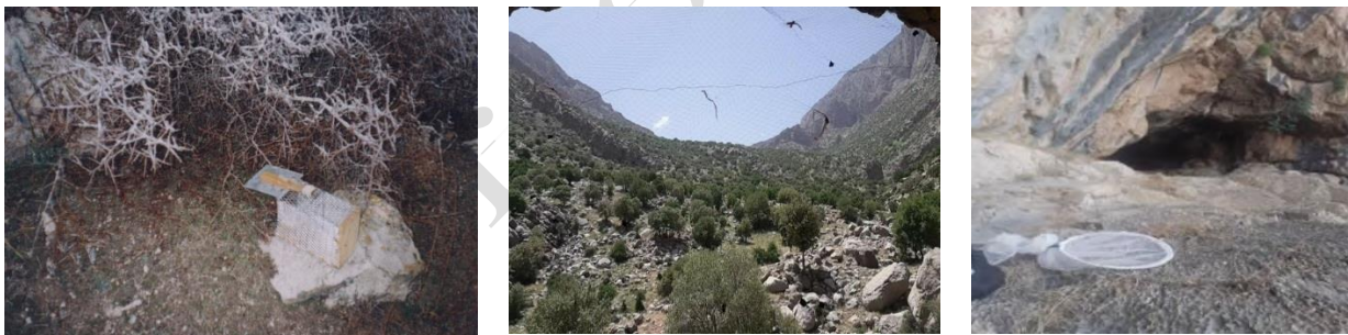
شکل ۲: توردهستی و تورنامرئی (MistNet) به ترتیب برای نمونه برداری خفاش‌ها در داخل غار و در دهانه غار، تله زنده گیر برای نمونه برداری از جوندگان.