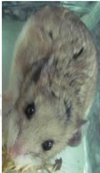
شکل ۶: کیسه‌دهان خاکستری (مهاجر) ( Cricetulus migratorius ).

کیسه‌دهان خاکستری یا مهاجر (در میان همه کیسه‌دهان‌ها بزرگترین محدوده جغرافیایی را اشغال می‌کند. رنگ پشتی این جانور، طوسی متمایل به خاکستری و گاهی متمایل به قهوه‌ای است (شکل ۶). رنگ شکمی بدن سفید است. دم کوتاه از طول سر و بدن کوتاه‌تر بوده و دارای موهای ریز و سفید رنگ است. گونه‌ای شب فعال است که حفره‌های عمیقی را برای زندگی و لانه سازی ایجاد می‌کند. در ایران این گونه به غیر از مناطق بیابانی و سواحل خلیج فارس و دریای عمان از اکثر مناطق گزارش شده است. به دلیل گستره وسیع پراکندگی و نداشتن تهدیدی خاص در طبقه «کمترین نگرانی» فهرست سرخ IUCN قرار دارد. این گونه برای اولین بار در شهرستان روانسر یافت شد.