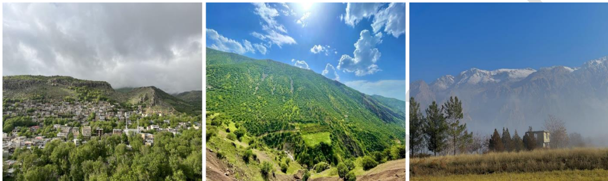
شکل ۱: تصاویری از روستای دوشه در شمال غربی شهرستان پاره.

می‌شد، اقدام به تله‌گذاری شد. بدین منظور ابتدا سوراخ‌های فعال محل زندگی جوندگان به منظور تله‌گذاری شناسایی شدند. فعال بودن سوراخ‌ها را می‌توان به وسیله‌ی خاک تازه‌ای که جونده به بیرون از سوراخ منتقل و یا از آثار مواد غذایی مورد استفاده در مدخل سوراخ و یا وجود سرگین تازه مشخص کرد. با توجه به اینکه اکثر جوندگان شب فعال هستند، لذا تله‌های زنده گیر نزدیک غروب آفتاب در محل‌های شناسایی شده قرار داده شد و اوایل صبح جمع‌آوری شد. شناسایی نمونه‌ها بر اساس کلیدهای شناسایی خفاشان (۹،۱۱) و جوندگان (۱۴-۱۶،۲۳) صورت گرفت. شکل ۱ تصاویری از منطقه مورد مطالعه را نشان می‌دهد. شکل ۲ روش نمونه برداری از خفاشان و جوندگان را نشان می‌دهد. نقشه پراکنش گونه‌ها با استفاده از نرم‌افزار ArcGIS نسخه (ESRI, 2013, 10.2) و بر پایه مختصات به‌دست‌آمده در کار میدانی و منابع منتشر شده رسم گردید.