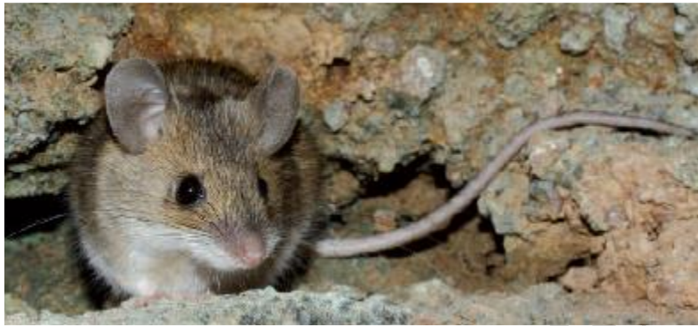
شکل ۷: موش کشتزار استپی Apodemus witherbyi (اقتباس از ۲۱).

موش کشتزار استپی گسترده‌ترین موش چوبی در ایران است (شکل ۷). این گونه به صورت هم‌جایگاه (syntopically) با Apodemus flavicollis در کوه زاگرس وجود دارد و با Apodemus hyrcanicus به صورت هم‌جا دیده می‌شود (۳۱). این گونه از روانسر گزارش شد. بر اساس فهرست سرخ IUCN در طبقه «کمترین نگرانی» قرار دارد.