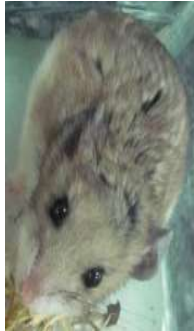
شکل ۶: کیسه‌دهان خاکستری (مهاجر) Cricetulus migratorius .

موش کشتزار استپی گسترده‌ترین موش چوبی در ایران است (شکل ۷). این گونه به صورت هم جایگاه (syntopically) با Apodemus flavicollis در کوه زاگرس وجود دارد و با Apodemus hyrcanicus به صورت همجا دیده می‌شود (۳۱). این گونه از روانسر گزارش شد. بر اساس فهرست سرخ IUCN در طبقه «کمترین نگرانی» قرار دارد.