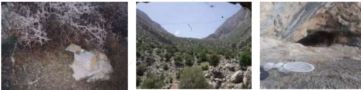
شکل ۲: توردستی و تورنامرئی (MistNet) به ترتیب برای نمونه برداری خفاش‌ها در داخل غار و در دهانه غار، تله زنده گیر برای نمونه برداری از جوندگان.

(Rhinolophidae)، شبانگهی (Vespertilionidae)، دم‌موشی (Rhinopomatiade) و بال‌خمیده (Miniopteridae) قرار می‌گیرند. از خانواده خفاش‌های نعل‌اسبی سه گونه نعل‌اسبی بزرگ ( Rhinolophus ferrumequinum )، نعل‌اسبی کوچک ( Rhinolophus hipposideros ) و نعل‌اسبی مهلی ( Rhinolophus mehelyi ) در هورامان یافت شد. خفاش‌های شبانگهی بزرگترین خانواده خفاش‌ها و یکی از متنوع‌ترین آنها در جهان است که از این خانواده، گونه‌های گوش‌موشی کوچک ( Myotis blythi )، انگشت‌دراز ( Myotis capaccinii )