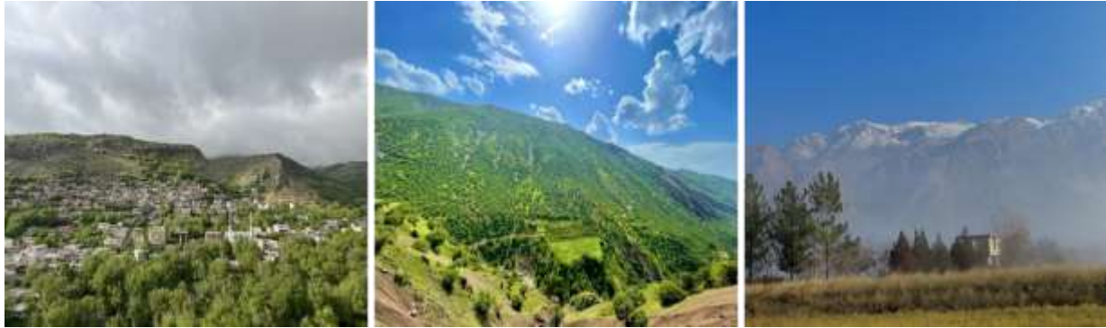
شکل ۱: تصاویری از روستای دشه در شمال غربی شهرستان پاپوه.

فعال بودن سوراخ‌ها را می‌توان به وسیله ی خاک تازه ای که جونده به بیرون از سوراخ منتقل و یا از آثار مواد غذایی مورد استفاده در مدخل سوراخ و یا وجود سرگین تازه مشخص کرد. با توجه به اینکه اکثر جوندگان شب فعال هستند، لذا تله های زنده گیر نزدیک غروب آفتاب در محل های شناسایی شده قرار داده شد و اوایل صبح جمع آوری شد. شناسایی نمونه‌ها بر اساس کلیدهای شناسایی خفاشان