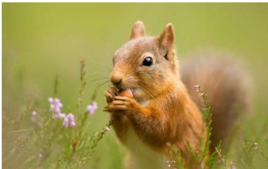
شکل ۵: سنجاب ایرانی Sciurus anomalus از منطقه اورامانات کرمانشاه.

سنجاب ایرانی تنها گونه از خانواده Sciuridae در خاورمیانه و جنوب غربی آسیا است. این گونه یک سنجاب درختی با جثه متوسط می‌باشد (شکل ۵). رنگ خز پشتی سنجاب‌های بالغ در زمستان از خاکستری مایل به سیاه کم‌رنگ تا نخودی مایل به قرمز کم‌رنگ متغیر است. رنگ شکمی اعضای این گونه از نخودی مایل به زرد کم‌رنگ روشن تا نخودی مایل به قرمز روشن متغیر است. سنجاب ایرانی در مناطق حفاظت شده نسبتاً فراوان است و به عنوان «کمترین نگرانی» در فهرست سرخ IUCN ذکر شده است. با این وجود، از دست دادن زیستگاه یکی از مهمترین دلایلی است که باعث کاهش جمعیت سنجاب ایرانی، به ویژه در لبنان، سوریه و ایران شده است. در طی این مطالعه پنج نقطه حضور برای این گونه ثبت شد (جدول ۲).