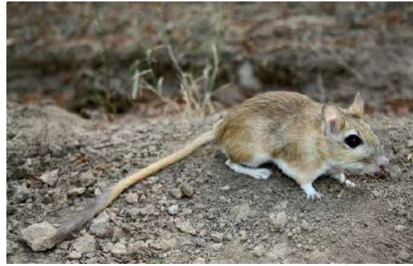
شکل ۸: جرد ایرانی Meriones persicus (اقتباس از ۲۱).

موش خانگی متعلق به جنس Mus (خانواده Muridae، زیرخانواده Murinae) است و مطابق با داده‌های تبارشناسی و دیرین‌شناسی مرکز و منشأ آن حدود ۶ میلیون سال قبل و در اواخر میوسن در زیر قاره هند است (۲۹). ویژگی‌های تشخیصی موش خانگی در درجه اول در مقایسه با گونه‌های مرتبط مانند موش صحرائی ( Mus spicilegus ) طول بدن بیشتری دارد. دم موش صحرائی بلندتر است اما به دلیل پایه ضخیم‌تر، به ویژه در نسل‌های پاییز-زمستان، "دم کوتاه‌تر" به نظر می‌رسد. این گونه از شهرستان روانسر در این مطالعه گزارش شد. این گونه به عنوان کمترین نگرانی توسط IUCN فهرست شده است و هیچ تهدید عمده‌ای برای این گونه وجود ندارد.