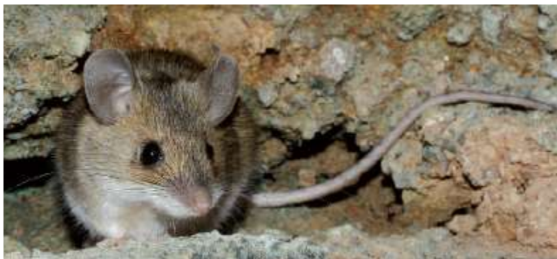
شکل ۷: موش کشتزار استپی ( Apodemus witherbyi ) (اقتباس از ۲۱).

کیسه‌دهان خاکستری یا مهاجر (در میان همه کیسه‌دهان‌ها بزرگترین محدوده جغرافیایی را اشغال می‌کند. رنگ پشتی این جونده، طوسی متمایل به خاکستری و گاهی متمایل به